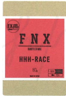
HHH-RACE 80g ¥5,500

ベース兼用超高速ペーストワックス 対応気温 -10℃~+10℃ 融点温度 72℃