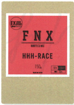
HHH-RACE 150g ¥8,250