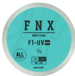
F1-UV ベースト 50g ¥1,650