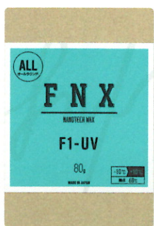
F1-UV 80g ¥2,200