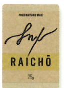
RAICHO 25g ¥1,100