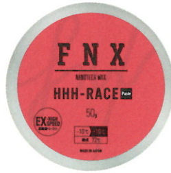
HHH-RACE ベースト 50g ¥3,850

ベース兼用超高速ペーストワックス 対応気温 -10℃~+10℃ 融点温度 72℃