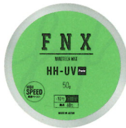
HH-UV ベースト 50g ¥2,750