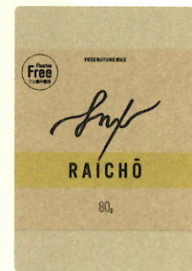
RAICHO 80g ¥3,080