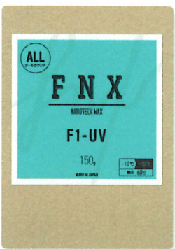
F1-UV 150g ¥3,300