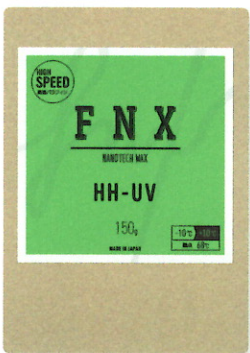
HH-UV 150g ¥6,600